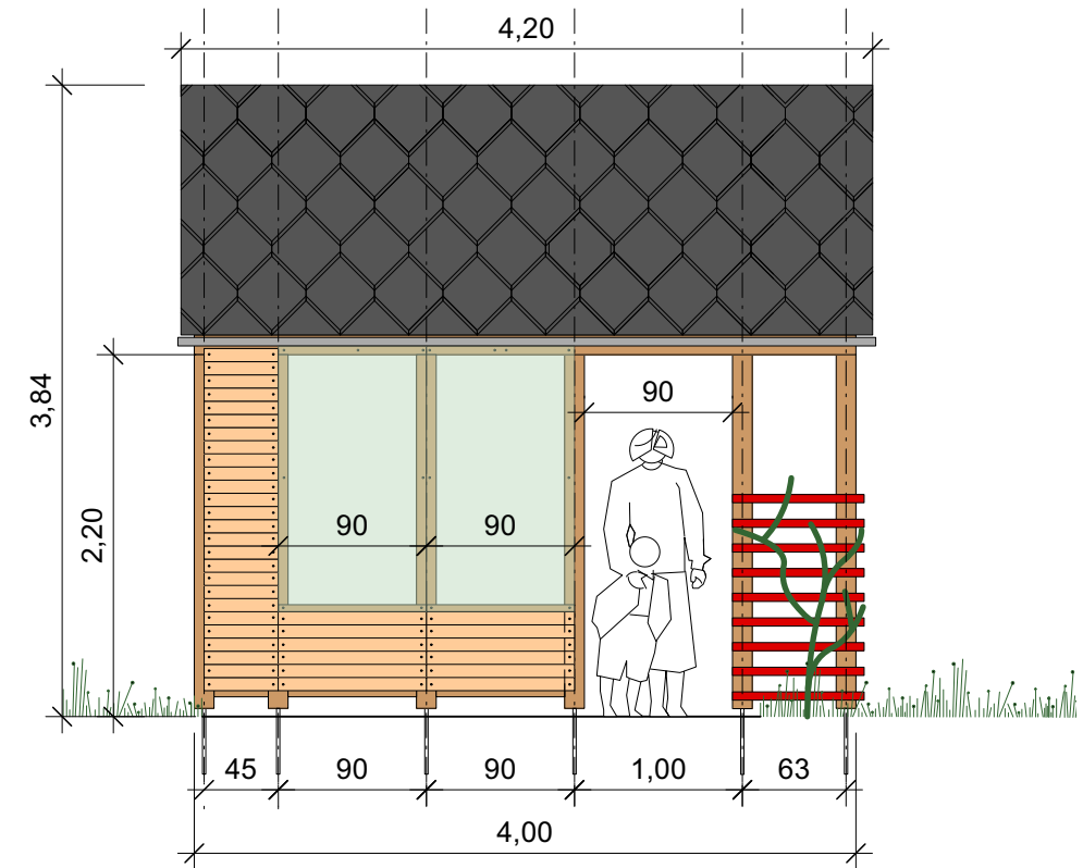
Vorderansicht Pavillon M1:50