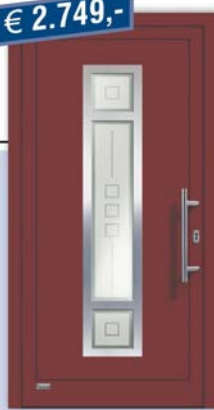
Aluminium-Haustür "Viona 01", RAL