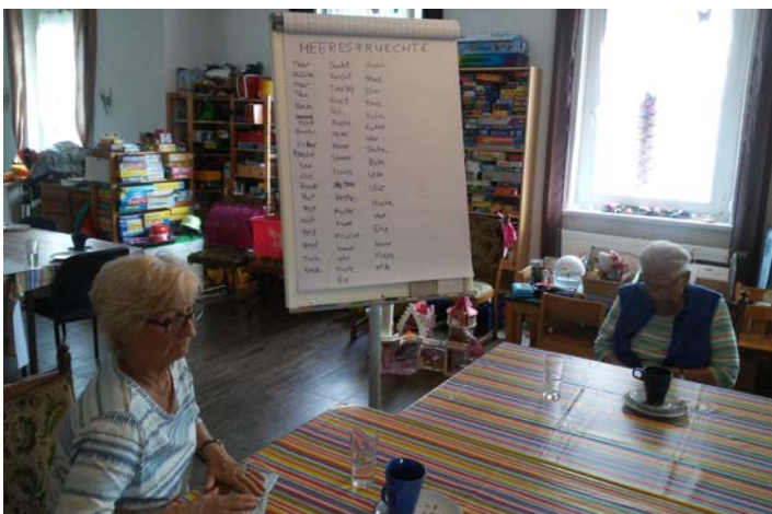
BINGO erfreut sich immer großer Beliebtheit

In der zweiten Gruppe wird auch viel gespielt und der Kopf mit anderen Denk- und Rateaufgaben in Schwung gehalten. Knobelaufgaben mit fehlenden Buchstaben, verdrehten Silben oder Ratefragen rund um Sommer, Sonne und Wasser ließen in den letzten Wochen keine Langeweile aufkommen. Vielleicht wollen Sie es einmal versuchen. Bilden Sie aus den Buchstaben des Wortes MEERESFRUECHTE 50 neue Worte. Wir haben es geschafft. Ich bin mir sicher, Sie schaffen das auch.