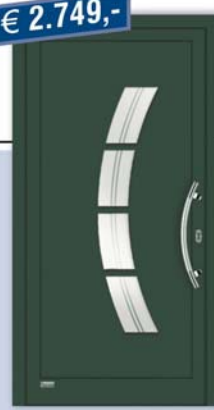
Aluminium-Haustür "Viona 07", RAL