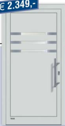
Kunststoff-Haustür "Viona 37", foliert