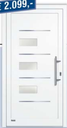
Kunststoff-Haustür "Viona 30", weiß