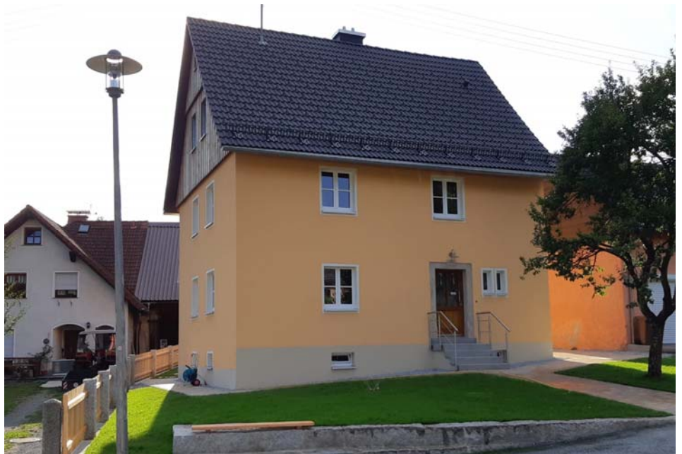
Die neu gestalteten Außenanlagen beim Dorfgemeinschaftshaus Förstenreuth

Das Regionalbudget konnte 2020 von den ILE-Regionen erstmals beantragt werden. Damit standen pro ILE-Region 100.000 € für Kleinprojekte zur Verfügung. Trotz des neuen Förderprogramms war in ganz Oberfranken das Interesse sehr groß. Insgesamt konnten mit dem Regionalbudget 195 Kleinprojekte in Oberfranken realisiert werden! Damit investierten Vereine, Stiftungen, Kommunen, Bürger etc. über 1,5 Millionen Euro in ihre Region. Ohne den zusätzlichen