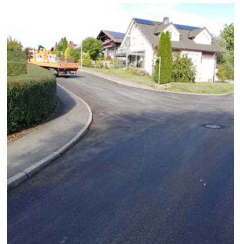
Bei der Baumaßnahme der Gemeindewerke wurde der Kreuzungsbereich Weickenreuther Weg / Landscheidbühl neu asphaltiert und in einen einwandfreien Zustand gebracht