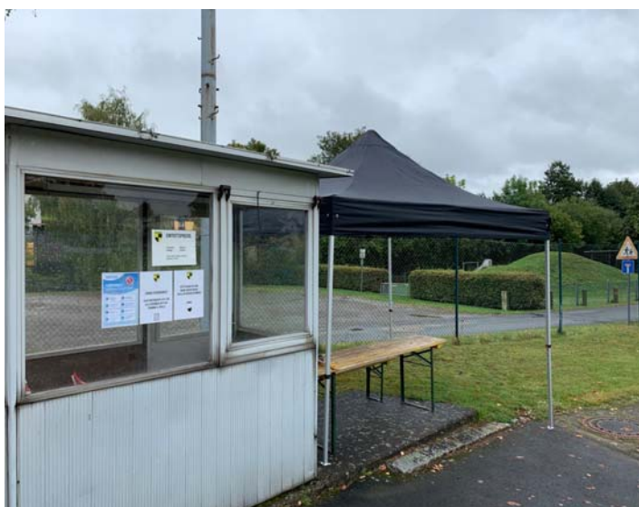
Eines der geförderten Zelte konnte auch schon erfolgreich bei der Corona-Registrierung beim ersten Heimspiel eingesetzt werden

Aus Stambach sicherten sich die Bewerbungen der Dorfgemeinschaft Förstenreuth (Außenanlagen Dorfgemeinschaftshaus) und des FC Stambach (Zeltstadtprojekt) Förderungen für ihre Projekte.