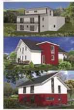
Planungsbeispiele Neubau Einfamilienhaus

www.schimmel-bau.de www.facebook.com/schimmelbaugmbh