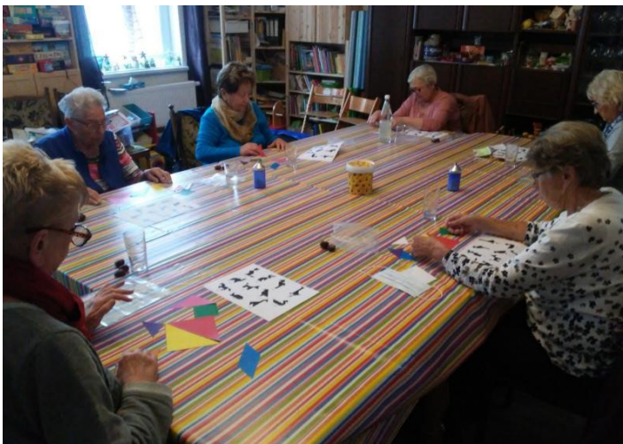
Ein brillantes Spiel mit Seltenheitswert ....mehr dazu im Bericht

Hier ein kleiner Auszug davon: Witzwort und Büchschinken (SH), Dümmer und Benzin (MV), Kuhbier und Ohnewitz (BB), Hundluft und Poppel (ST), Lederhose