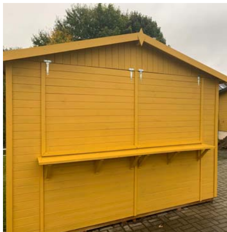
Auch ein Verkaufsstand wurde bereits aufgebaut und mit Wetterschutzfarbe winterfest gemacht

Einsatz von ehrenamtlicher Arbeit wäre die Umsetzung der Projekte nicht realisierbar gewesen. Alle 195 Projekte wurden durch das Regionalbudget mit maximal 80% auf die Nettogesamtkosten gefördert. Somit flossen insgesamt 940.000 € Förderung in die Kleinprojekte.