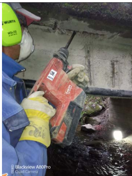
Die Brücke an der Kläranlage wird aktuell saniert - auf den Bildern legt ein Arbeiter der beauftragten Fachfirma Schadstellen mit schwerem Gerät frei - der Bauhof unterstützt die Maßnahme begleitend