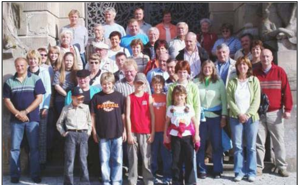
Die Ausflügler des Fischereivereins Stammbach vor dem Schloss Weißenstein, der „Perle Frankens“.

Nach den kulturellen „Schmankerl'n“ musste natürlich auch für das leibliche Wohl der Reisegruppe ge-