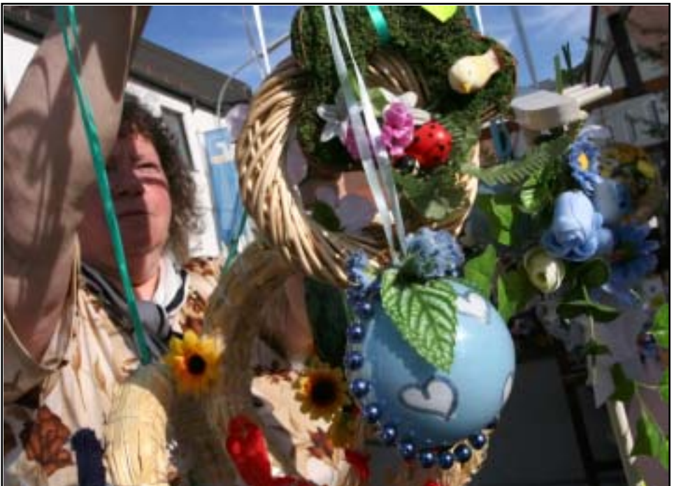
Viele Dekorationsartikel schmückten den Markt.