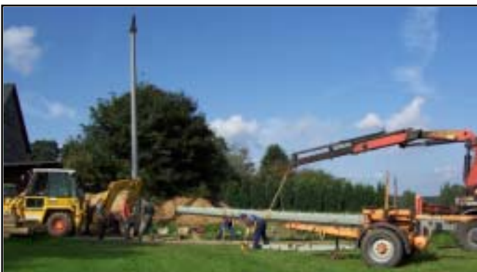
Der alte Betonmast im Bereich des Anwesens Mnich kurz vor dem Abbau. Der neue Endmast aus Metall hängt bereits am Haken des Kranes.