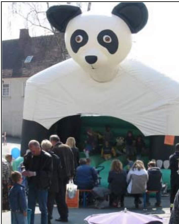
Die Hüpfburg ist der Renner bei den Kindern.