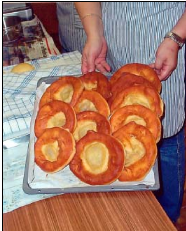
Frische Kiechla gibt's zur Kärwa.