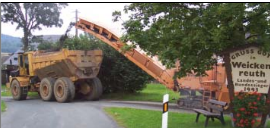
Die Bauarbeiten im Bereich Weickenreuth.