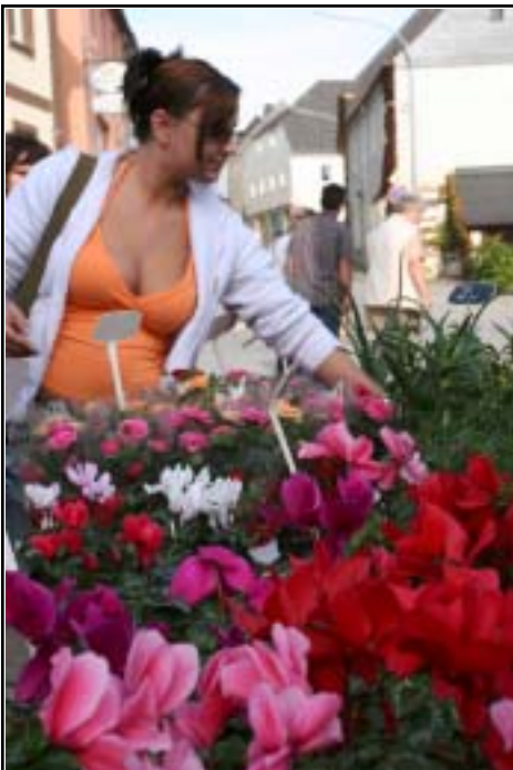
Einiges zu sehen gab es an den Ständen der Markthändler

auch Stambach keine Ausnahme.“ Zufrieden war sie dennoch sehr. Die Kinder konnten sich auf einer großen Hüpfburg den ganzen Tag lang austoben, während auch die Stambacher Geschäfte geöffnet hatten. Dazu gab's zwei gemütliche Biergärten und ein Cafe, in denen viele ihren Marktbummel ausklingen ließen und bei Häppchen, Wein und Federweisen teils bis in die späten Abendstunden sitzenblieben.