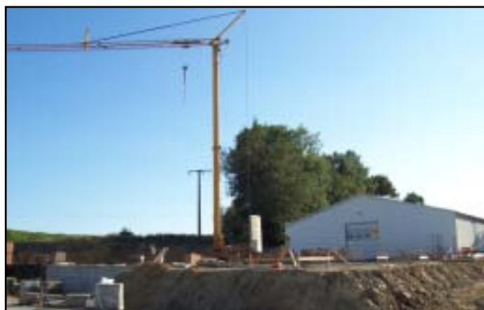
Der Hallenbau der Firma Verotex geht zügig voran. Hier werden gerade die Fundamente betoniert. Der Baukran ist bereits aufgestellt.

Seit Wochen stehen viele Baumaschinen im und um das Gewerbegebiet am Senftenhofer Weg. Grund ist das Investitionsvorhaben der Stammbacher Firma Verotex AG. Weil die Firma wächst und investiert, wird auf dem Gelände des Gewerbegebietes Senftenhofer Weg eine neue Halle mit neu angelegter Zufahrt und Verladehof gebaut. Durch den Ausbau werden auch neue Arbeitsplätze geschaffen. Die Arbeiten stehen unter einem hohen Zeitdruck, weil die Produktion möglichst bald anlaufen soll.