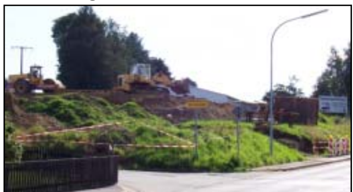
Umfangreiche Erdarbeiten waren notwendig, um das Baugelände vorzubereiten. Auch eine neue Zufahrt in Richtung Senftenhofer Weg wurde geschaffen. Der große Betonmast der 20.000 Volt-Freileitung, der bislang an der Ecke der Einmündung in den Senftenhofer Weg stand, ist bereits abgebaut. Auch die Stromleitung ist schon verschwunden. Die Bauarbeiten können ungehindert weitergehen.

dieses Kabel erfolgt nun die Versorgung von Stammbach. Mit der Verlegung des Erdkabels wurde auch die Gasleitung weiter in Richtung Bahnhofgebiet und Kreuzburger Straße geführt. Auch ein Telekomkabel musste verlegt werden, weil es störte.