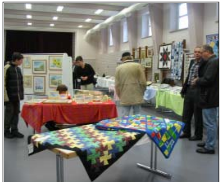
Viele Hobby-Künstler stellten 2002 in der Schulturnhalle aus. Die Besucher waren begeistert.