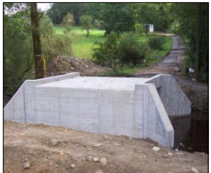
Rohbau der Brücke bei der Kropfmühle.