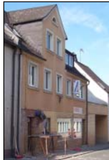
Das Haus von Hermann Wirth nach (links) und vor der Sanierung.

Haustür, weiter über die Umgestaltung der großen Schaufenster, die Möglichkeit der Ausbildung eines Natursteinsockels, die Anordnung und die Form der Werbeschrift, bis hin zur Material- und Farbfestlegung wurde alles harmonisch aufeinander abgestimmt. Besonders wichtig war hierbei die Entscheidung des Bauherrn, den hohen Fliesensockel zu entfernen und sich für eine gut proportionierte Granitverblendung zu entscheiden. Auch die Wahl einer massiven Holzhaustür in natürlichem Farbton belebt die Fassade und gibt ihr eine besonders ansprechende und einladende Note.