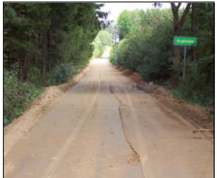
Vorbereitung für das Straßenplanum in Höhe der Kropfmühle Richtung Sauerhofer Straße.