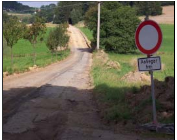
Der alte Straßenbelag auf dem Weg Förstenreuth-Wildenhof wird abgefräht.