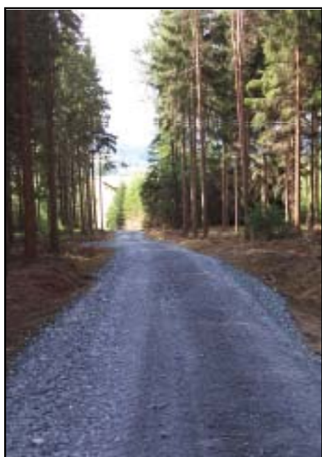
Neuer Waldweg am Karlsberg während der Bauarbeiten.