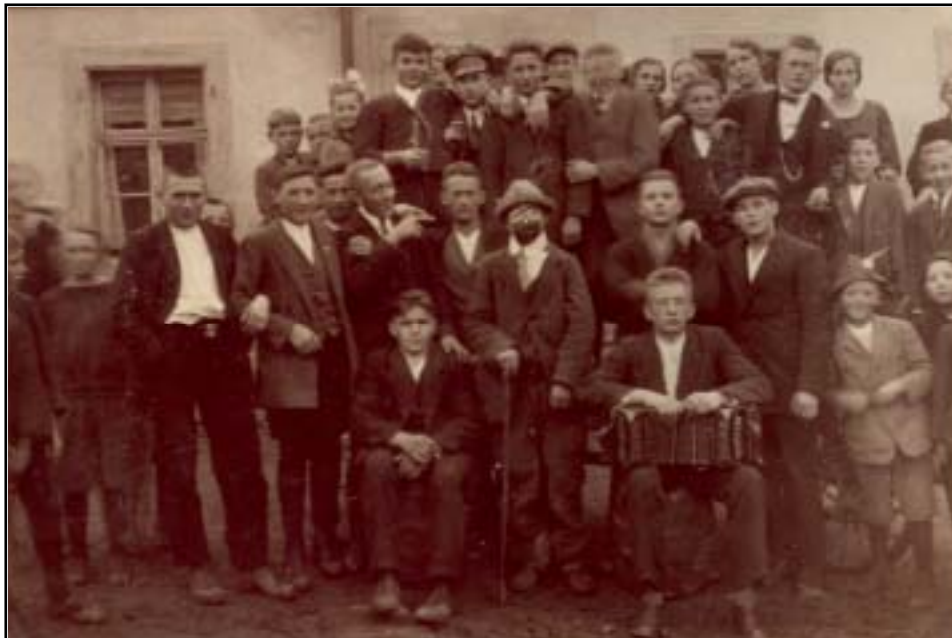
Kirchweihsonntag anno dazumal.