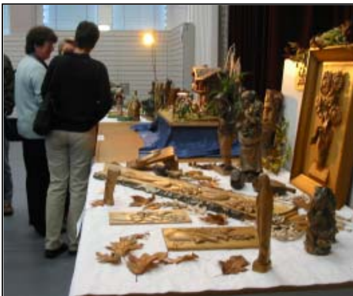
Schnitzereien und Weihnachtskrippen standen hoch im Kurs.