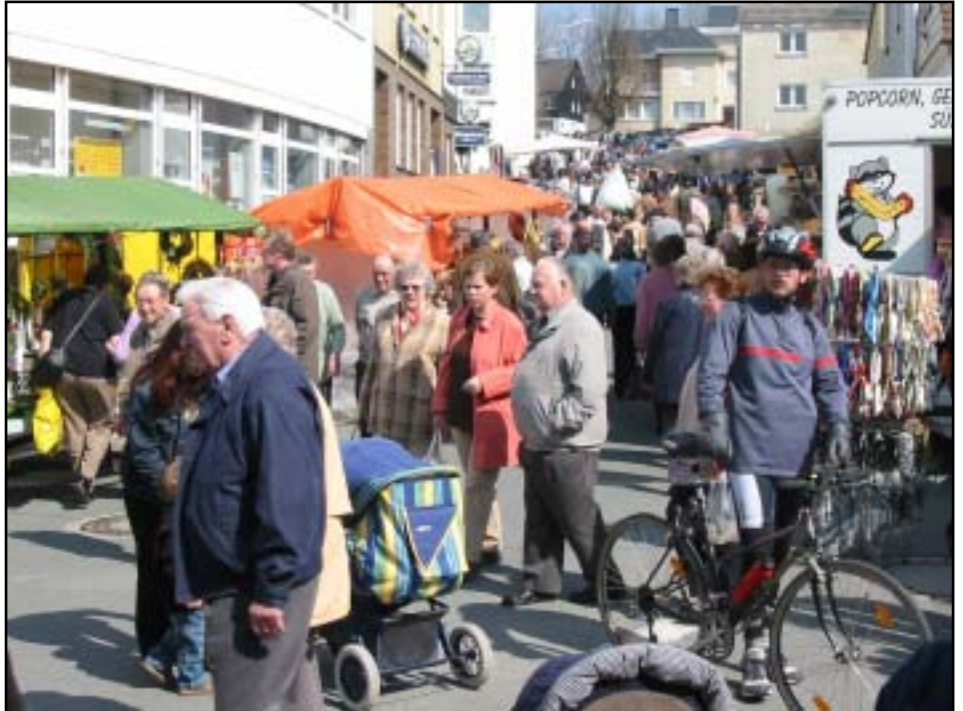
Die „Einkaufsmeile“ lädt zum Schlendern und Stöbern ein.

Auch über das Angebot beim Weinfest hinaus gibt es reichlich Gelegenheit zum Sattessen: Zwischen