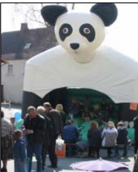
Viel Spaß ist auf der Hüpfburg garantiert.

Damit nicht genug: Die Stambacher Geschäftswelt lädt natürlich wieder zum verkaufsoffenen Sonntag ein: Von 11 bis 16 Uhr kann man bummeln, Herbstkollektionen be-