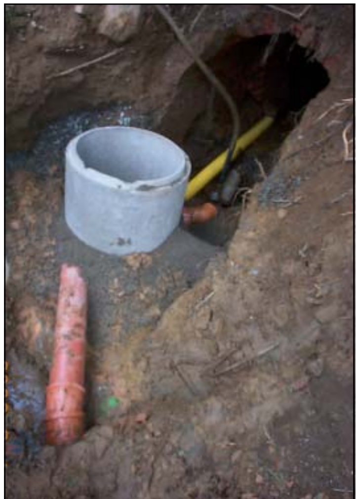
Frishwassereinlaufschacht vor dem Wasserstollen der Firma Nietert.

Investitionen solcher Maßnahmen finanzieren sich in den nächsten Jahren selbst. Die Baumaßnahme wurde von der Firma Bauer, Tennersreuth, und den Gemeindewerken durchgeführt.