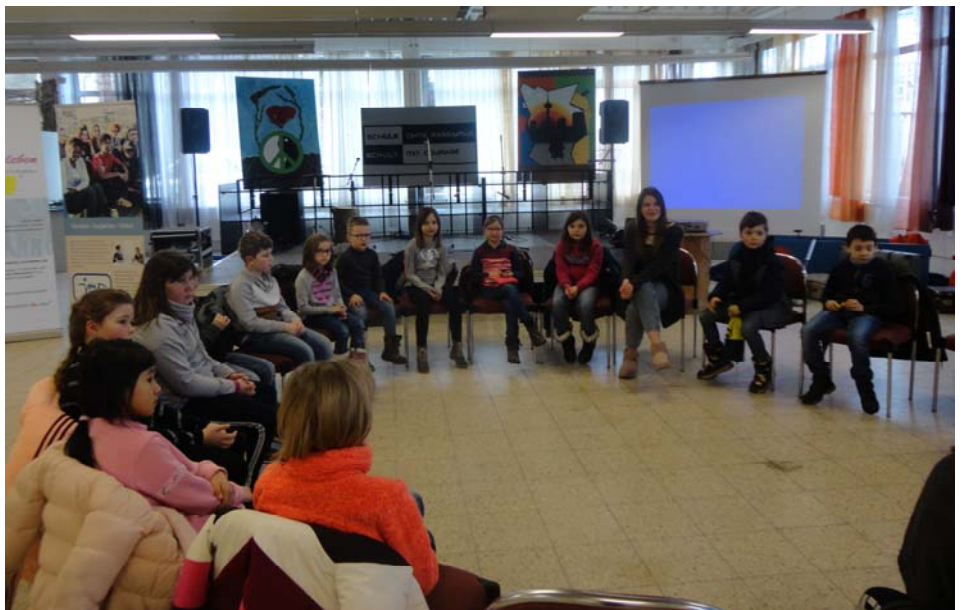
Abschlussrunde bei der Ausstellung "YOUNIWORTH" in Helmbrechts