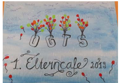
Im vergangenen Jahr haben sich die Gäste des Elterncafés mit einem Fingerabdruck auf dieser Leinwand verewigt