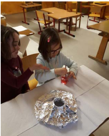
"EXPERIMENTIEREN": Spannung beim Experiment "Vulkanausbruch"

Das Projekt beschäftigte sich mit allem, was die Kinder an Interessen und persönlichen Fähigkeiten (z.B. Hobbies oder besondere Talente) mitbrachten. Individualität stand im Fokus! Egal ob Bewegung oder Kreativität, hier kam jeder zum Zug!