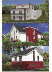
Planungsbeispiele Neubau Einfamilienhaus