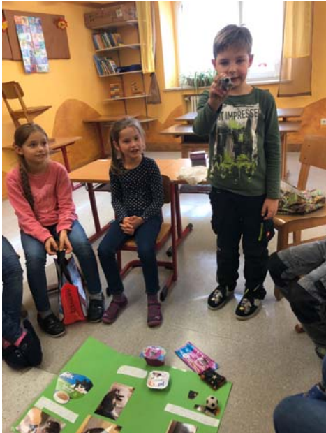
"BE YOURSELF": Die Kinder mit ihren Fähigkeiten und ihrer Persönlichkeit stehen im Fokus

Im vergangenen Halbjahr konnten die Kinder, die bis 16.00 Uhr die Offene Ganztagschule besuchen, an verschiedenen Projekten teilnehmen: