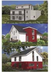
Planungsbeispiele Neubau Einfamilienhaus