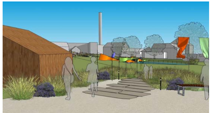
So könnten die Färberwege in Stambach aussehen. Auf Pfaden abseits der Straßen sollen sogenannte Färberpflanzen blühen und auch Fahnen könnten auf die lange Textilgeschichte Stambachs hinweisen. In einem Färbergarten im Rathausquartier soll ein blühendes Pflanzenmeer zum Verweilen einladen. Mehr Bildmaterial befindet sich auf der Homepage: https://www.stambach.de/bauen-und-wohnen/stambach-macht-mit/integriertes-staedtebauliches-entwicklungskonzept/isek-2020

Gearbeitet wurde in drei thematischen Gruppen, zwei zu den konkreten Projekten und eine weitere zum Thema „Wie können wir Leute zum Mitmachen gewinnen?“