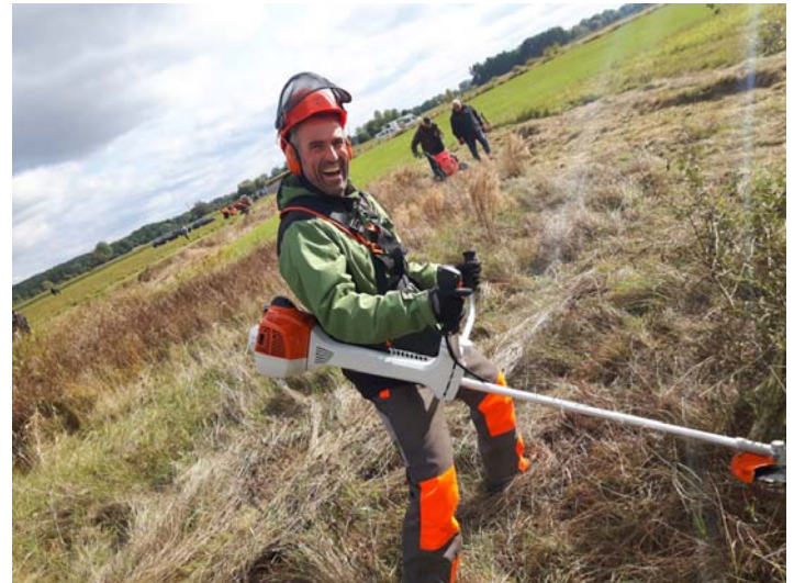
Der Lehrgang zum Geprüften Natur- und Landschaftspfleger/zur Geprüften Natur- und Landschaftspflegerin startet im September 2022.

In Theorie und Praxis sowie in vielen Exkursionen lernen die Teilnehmerinnen und Teilnehmer unter anderem die Grundlagen des Naturschutzes und der Landschaftspflege, Umweltbildung und Öffentlichkeitsarbeit, aber auch Grundsätze des Gewerbe- und Steuerrechts oder des Arbeits- und Sozialrechts. Schwerpunkte bilden zudem der Einsatz von Maschinen und Geräten in der Landschaftspflege, die fachgerechte Pflanzung und Pflege von Hecken und Gehölzen, naturschutzfachliche Grundlagen sowie Umweltpädagogik.