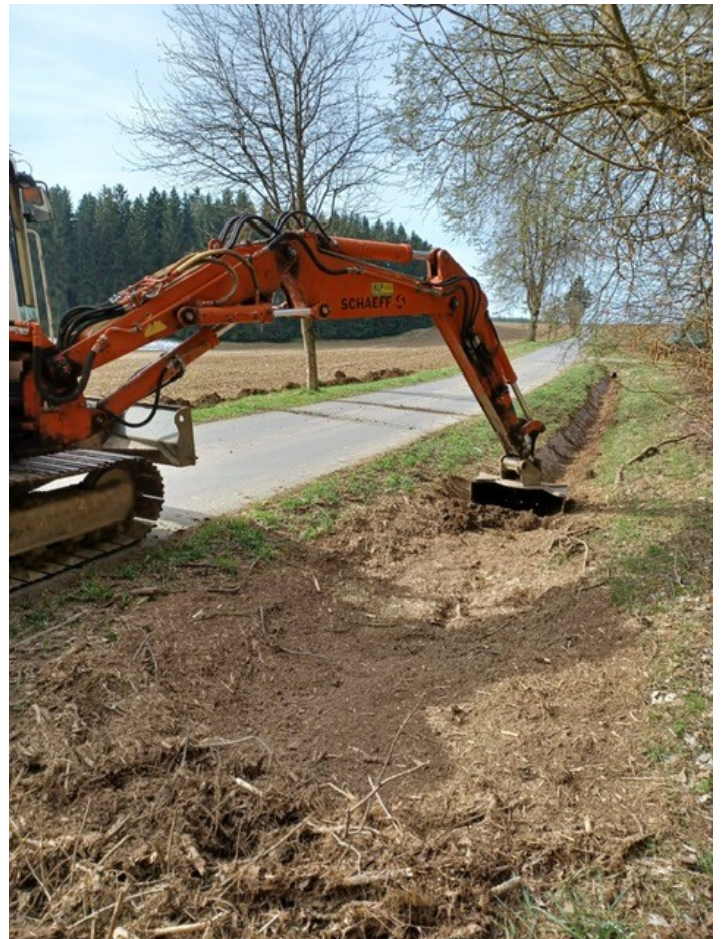
Nach dem Unwetter bei der Kropfmühle wurde der Graben geräumt.