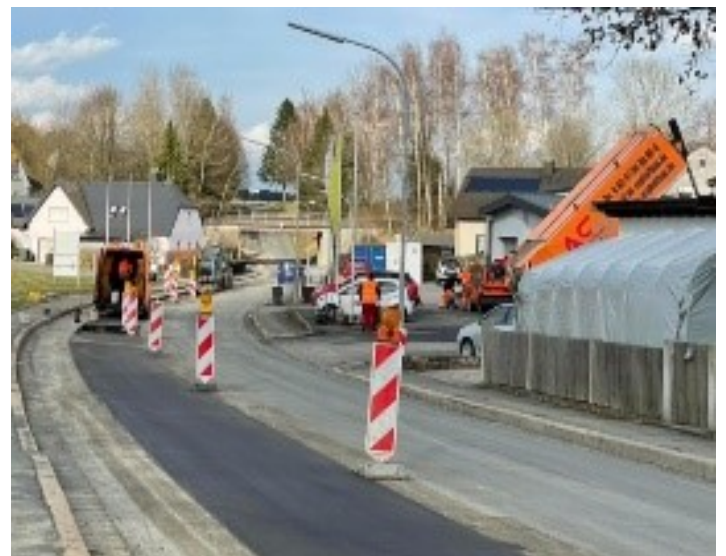
Die 20 kV-Kabelverlegung durch das Bayernwerk geht voran.

Und mit dem neuen Fahrradweg von Stammbach nach Gundlitz geht es auch bald los. Ebenso mit dem Abriss und der Neugestaltung des Anwesens Rathausstraße 8. Infos und Pläne zu allen Maßnahmen finden Sie auf der Homepage www.stammbach.de .