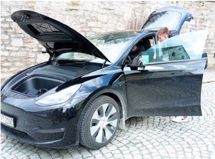
Die E-Autos konnten besichtigt werden.