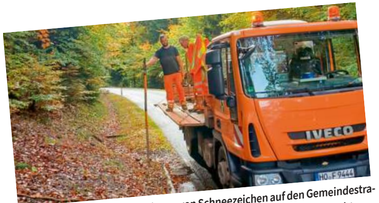
Wintervorbereitungen: Ausbringen von Schneezeichen auf den Gemeindefahrwegen und -wegen. Außerdem wurden auch die Streukästen ausgebracht.