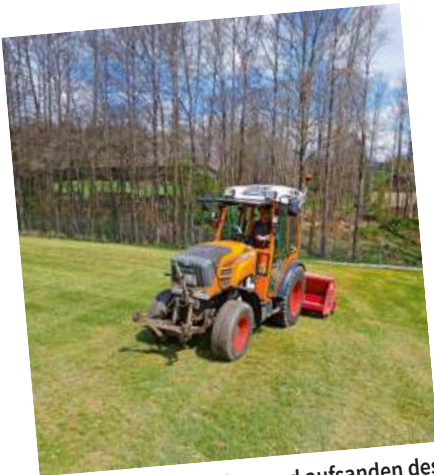
Aerifizieren, nachsähen und aufsanden des Sportplatzes, damit dieser bespielbar bleibt und der Rasen gleichmäßig wächst.