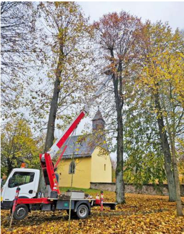
Entfernung von Totholz bei der Friedhofskapelle und Totbäumen in der Bahnhofstraße zur Gewährung der Verkehrssicherheit.