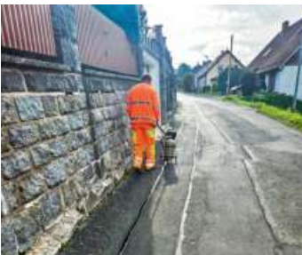
Rissanerierung in der Altstammbacher Straße, Jahnstraße, Zelchstraße, Bergstraße, Obere Hangstraße und Schulstraße.