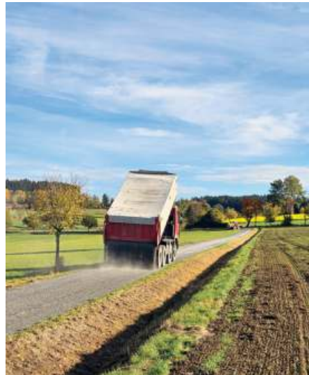
Wassergebundene Wege: Auf den Verbindungswegen HO35 zur Bergmannseinzeln und Rindlas Richtung Weißenstein wurde ein 0/8 Splitgemisch aufgezogen und mit einer Walze verdichtet.