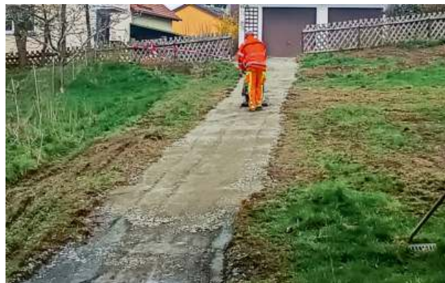
Wegebau: Fußweg (vor Stammbach leuchtet) Bahnhofstraße 21 Richtung Kirchhühstraße; Wird gerne von Schülern und allen Bürgerinnen und Bürgern genutzt.