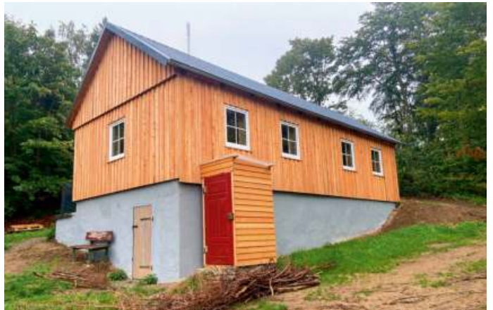
Waldhütte am Weißenstein: Innenwände und Decken wurden mit OSB neu verkleidet; die Außenverkleidung wurde mit Lärchenbrettern realisiert und neue Kunststoffenster eingesetzt. Das Dach wurde mit Kanthölzern ausgeglichen und mit Trapezblech gedeckt. Besonderer Dank geht hier auch an die Firma Therma aus Bad Steben für die Spende der Fenster und an die Firma Bonenberger aus Marktschorgast für das Schneiden der Lärchenbretter als Spende.