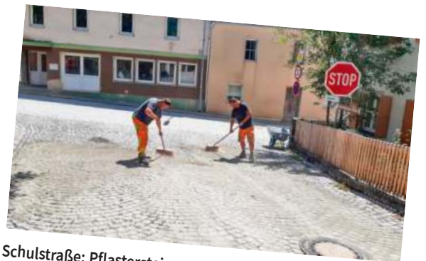
Schulstraße: Pflastersteine wurden mit Brechstein/Zementgemisch verfugt um die Befahrbarkeit und Festigkeit der Steine gewährleisten zu können.