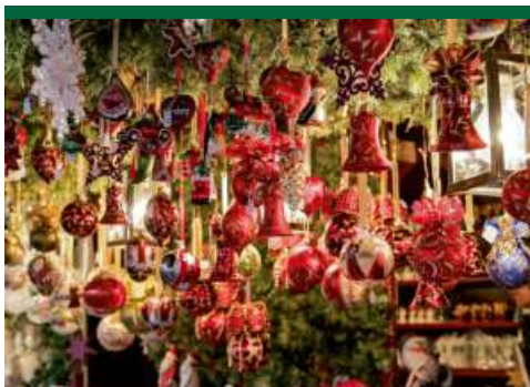
1. Stammbacher Adventsmarkt: Am Samstag, 9. Dezember, ab 14 Uhr