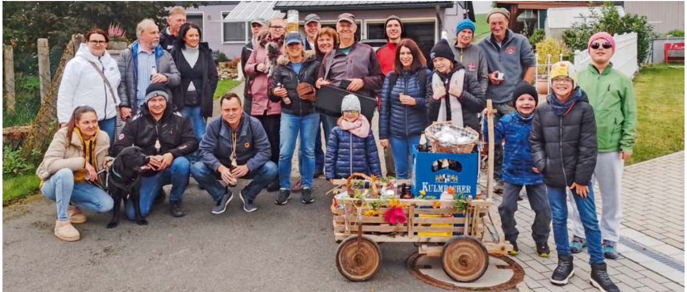
Kerwa, Kerwa, Kerwa halte es am Kärwasamstag in Gundlitz durch die Straßen, als die Kerwagesellschaft traditionell von Haus zu Haus zog. Nach dem Umzug kehrte die Gesellschaft im Dorfhaus ein, um den Kärwausklang bei gutem Essen und Getränken zu feiern.