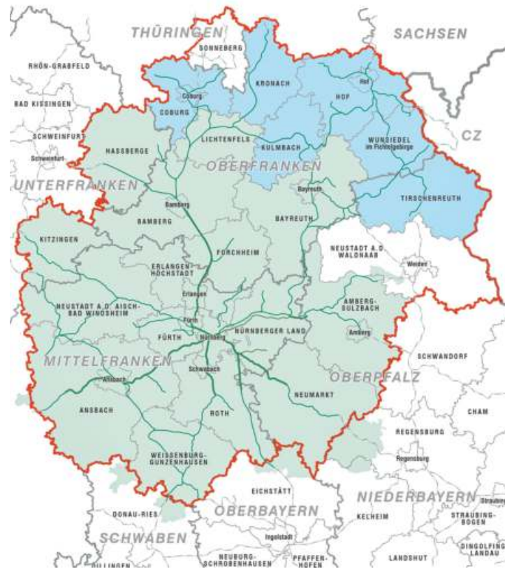
Eine Übersichtskarte des Verbundgebiets

Unbegrenzt fahren ermöglichen die Zeitkarten mit und ohne Abo, wie etwa das Deutschlandticket (49 bzw. 29 Euro-Ticket), das 365-Euro-Ticket für Schüler oder Wochen- und Monatskarten. Für gelegentliche Fahrten stehen Einzelfahrkarten, Streifenkarten, Vierer-Tickets und Tagestickets zur