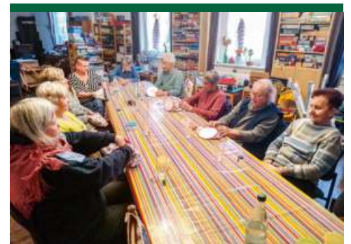
Nachbarschaftstreff: Rückblick auf bunt gefüllte Wochen