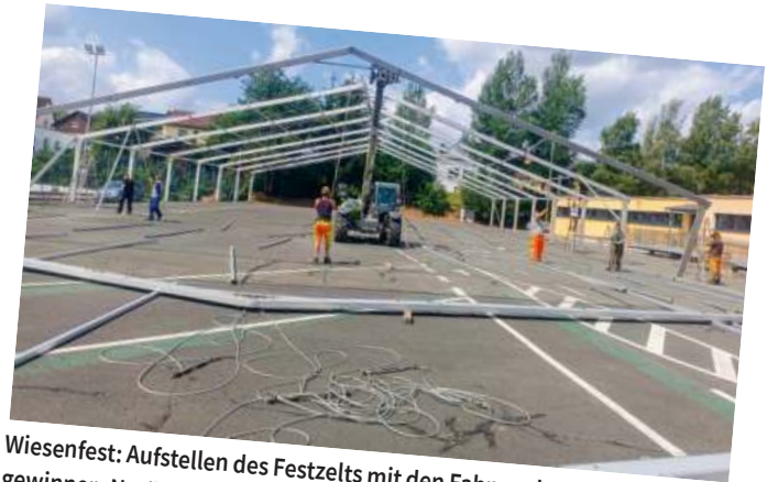
Wiesenfest: Aufstellen des Festzelts mit den Fahnen der Malwettbewerbsgewinner; Natürlich wurden, wie jedes Jahr, auch die Straßen und Plätze/ Anlagen gesäubert und die Fahnen an der Straße aufgehängt.