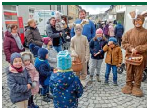
Zwei Osterhasen gesucht: Für den Ostermarkt am 24. März 2024